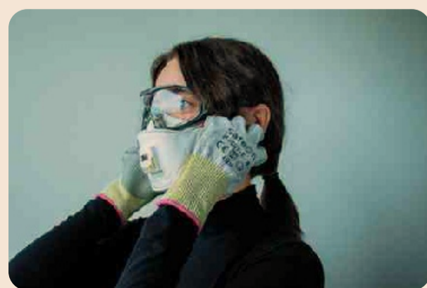
Formazione e aggiornamento costante dei tecnici per supportare le criticità legate al mondo antinfortunistico

Ecco dunque che Nicma può davvero essere il partner giusto per accompagnare in questo tipo di transizione molte delle aziende che si impegnano a rispondere a questa esigenza, obiettivo chiave riconosciuto per ogni Società che punti al successo.