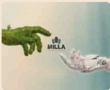
Milla: tra green e hi-tech

In questi ultimi anni ha infatti avviato una serie di investimenti mirati ad abbattere in maniera sostanziale i consumi e le emissioni in atmosfera. L'installazione di un impianto fotovoltaico oggi permette di sviluppare la quasi totalità dell'energia elettrica utilizzata nei suoi stabilimenti produttivi. L'acquisto di nuove presse ad iniezione full-electric, un nuovo impianto di aspirazione polveri e fumi che garantisce la salubrità degli ambienti lavo-