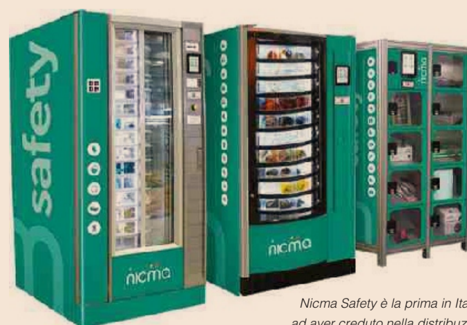
Nicma Safety è la prima in Italia ad aver creduto nella distribuzione automatica di DPI