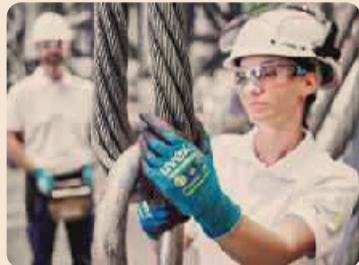
Uvex: DPI dalla testa ai piedi per la sicurezza nei luoghi di lavoro

Con oltre 95 anni di esperienza, UVEX è uno dei maggiori produttori di DPI con molti stabilimenti produttivi in Germania e in Europa e 1800 persone impiegate. Da sempre, sosteniamo il nostro motto protecting people offrendo dispositivi di protezione per la sicurezza nei luoghi di lavoro. Il nostro impegno per la protezione delle persone comprende anche la responsabilità nei confronti della società e dell'ambiente. Per questo, perseguiamo degli obiettivi ambiziosi in termini di sostenibilità lavorando costantemente sugli impianti di produzione per aumentare l'efficienza energetica, portare a zero le emissioni di carbonio e offrire sul mercato prodotti dura-