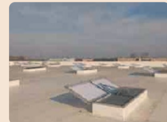
Il sistema ENFC SMOKE ARIES® funziona a bassissima tensione

tura automatica dei dispositivi in caso di emergenza. I punti di forza che contraddistinguono questo nuovo ENFC da tutti gli altri della gamma a battente sono: