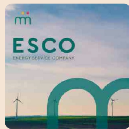
I migliori interventi in ambito energetico al servizio di un mondo più green

Con la divisione Nicma Safety, nata nel 2001, l'azienda si propone di sopperire alle necessità del mercato commercializzando e distribuendo DPI e abbigliamento antinfortunistico su tutto il territorio nazionale. In un'ottica customer-centric, la Divisione fornisce un servizio a 360° e, grazie a quelle idee visionarie e geniali tipiche delle realtà imprenditoriali del nostro Paese, è stata la prima azienda in Italia ad aver creduto nella distribuzione automatica come canale chiave per la vendita